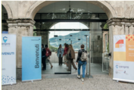
Figura 2: Non Profit Day – menzione dell'evento nel rapporto annuale di proFonds (sinistra) e testimonianza di Roger Bergonzoli (destra)

Der vom CENPRO veranstaltete Non Profit Day 2022 stand unter dem Patronat von proFonds.