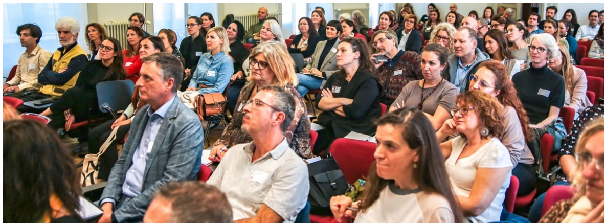
Figura 1: Non Profit Day organizzato da cenpro, 111 persone presenti presso Villa Negroni